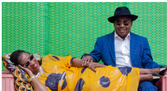
Amadou et Mariam

Automne 2018, Gentilly, France : la potion magique des 5 vingtenaires de Theo Lawrence & The Hearts est prête. Animée par un condensé de 80 ans d'histoire de la soul, du blues, du rock'n'roll, de la folk, du hip hop, de la country music, la platine vinyle tourne à plein régime. Le voyage dans le temps proposé par ces jeunes gens modernes séduit : après 2 singles très remarquables, le groupe enchaîne les dates partout dans le monde et sort un premier album, Homemade Lemonade .