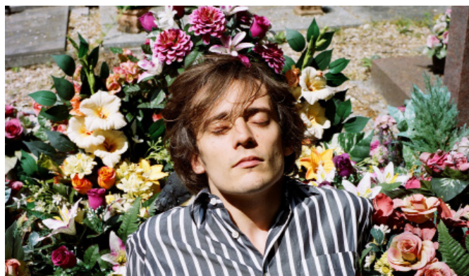
Dani Terreur © Severin