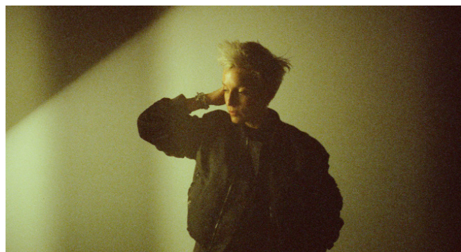
Jeanne Added

Originaires de Nîmes, les quatre membres de VSO, accompagnés du youtubeur Maxenss, cherchent à montrer que la musique urbaine n'est pas uniquement sociale, mais surtout générationnelle. À la fois hâbleur et pétri de doutes, ce rap des classes moyennes, d'une jeunesse « normale », décrit une réalité largement partagée dans des refrains accrocheurs, solaires, aux mélodies galbées.