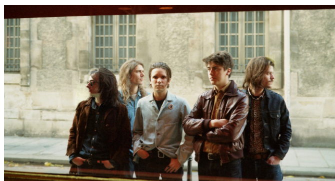
Theo Lawrence and the Hearts

Programme centré sur les œuvres du pianiste Thelonious Monk, autour d'arrangements inédits écrits par Alain Soler