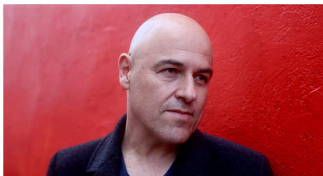
Dominique A

Dans son premier album sorti en mars 2018, Palatine raconte ces entrelacs de destins qui nous emmènent ici ou ailleurs, avec tel ou tel autre, à nous aimer, à nous haïr. Le groupe, constitué de quatre membres, cultive des influences Folk / Rock dont se dégagent une poésie noire, un (dés)espoir lumineux, induits par une écriture au cordeau et des arrangements crépusculaires.