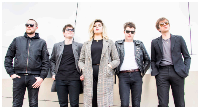
Metro Verlaine