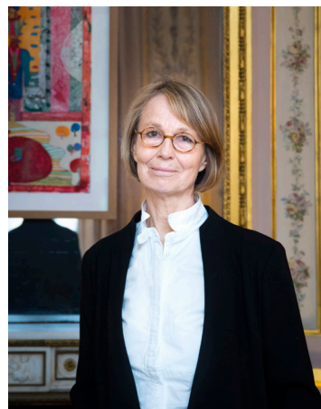
Françoise Nyssen

Pour la 37ème année consécutive, la journée la plus longue de l'année sera aussi la plus musicale : une fois encore, la Fête de la Musique inaugure l'été.