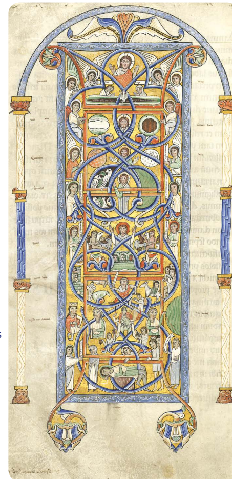
MS2 Grosse bible de Chartreuse - Bibliothèque municipale Grenoble

/ DIMANCHE 16 SEPT. À 10H30, 13H30, 15H, 16H30